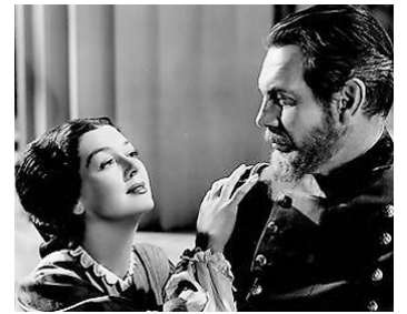
1947 LE DEUIL SIED À ÉLECTRE (Mourning becomes Electra) de D. Nichols avec R. Russell