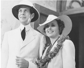
1937 L'OURAGAN (Hurricane) de John Ford avec Mary Astor