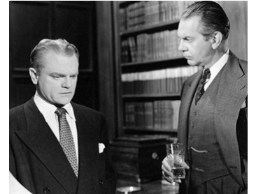
1951 FEU SUR LE GANG (Come fill the Cup) de Gordon Douglas avec James Cagney