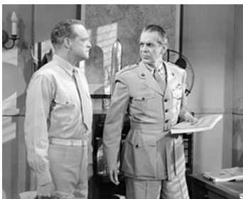
1954 LE CRI DE LA VICTOIRE (Cry Battle) de Raoul Walsh avec Van Heflin