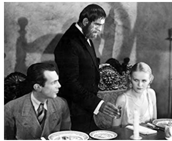
1932 LA MAISON DE LA MORT (The old dark House) de James Whale avec Boris Karloff, Gloria Stuart