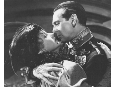
1937 LE PRISONNIER DE ZENDA (The Prisoner of Zenda) de John Cromwell avec Mary Astor