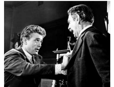
1954 À L'EST D'EDEN (East of Eden) d'Elia Kazan avec James Dean