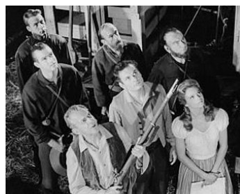
1961 LES RÉVOLTÉS DU CAP (The Fiercest Heart) de George Sherman avec Juliet Prowse