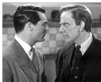
1944 ARSENIC ET VIEILLES DENTELLES (Arsenic and old lace) de Frank Capra avec Cary Grant