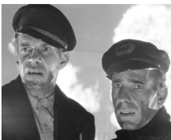
1943 CONVOI VERS LA RUSSIE (Action in the North Atlantic) de L. Bacon avec H. Bogart