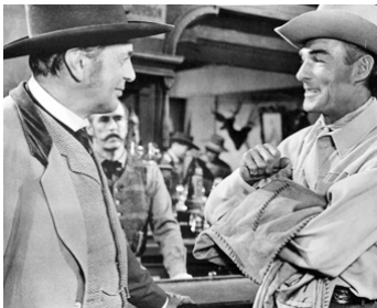
1952 LES CONQUÉRANTS DE CARSON CITY (Carson City) d'A. De Toth avec Randolph Scott