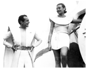
1936 LA VIE FUTURE (Things to come) de William Cameron Menzies avec Isla Bevan