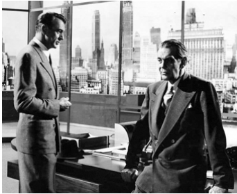
1949 LE REBELLE (The Fountainhead) de King Vidor avec Gary Cooper