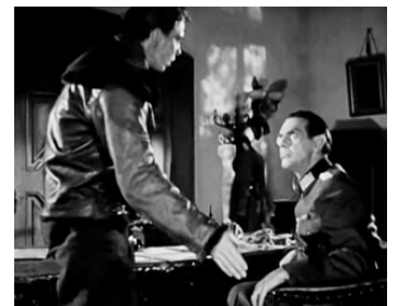
1942 SABOTAGE À BERLIN (Desperate Journey) de Raoul Walsh avec Ronald Reagan