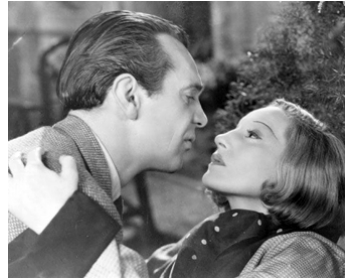
1936 MÉLO (Dreaming Lips) de Paul Czinner avec Elisabeth Bergner