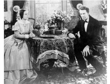
1939 ABRAHAM LINCOLN (Abe Lincoln in Illinois) de John Cromwell avec Ruth Gordon