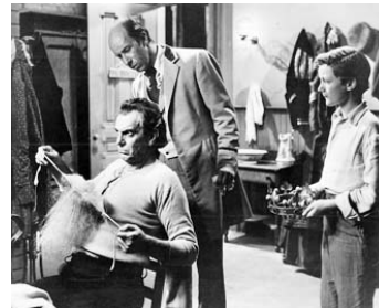
1954 LE PRINCE DES ACTEURS (Prince of Players) de Philip Dunne avec Christopher Cook