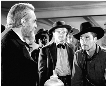
1940 LA TERRE DES RÉVOLTÉS (Santa Fe Trail) de M. Curtiz avec Errol Flynn, Van Heflin