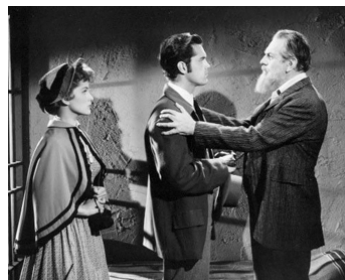
1955 SEVEN ANGRY MEN de Charles Marquis Warren avec Debra Paget, Jeffrey Hunter