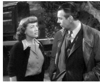
1947 LA POSSÉDÉE (Possessed) de Curtis Bernhardt avec Joan Crawford