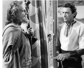
1951 DAVID ET BETHSABÉE (David and Bethsheba) d'Henry King avec Gregory Peck