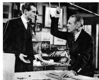
1961 THE QUEEN'S GUARDS de Michael Powell avec Daniel Massey