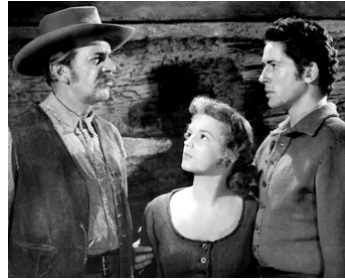
1949 ROSEANNA MCCOY (Roseanna McCoy) d'Irving Reis avec Joan Evans, Farley Granger