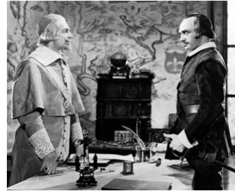
1936 SOUS LA ROBE ROUGE (Under the red Robe) de Victor Sjöström avec Conrad Veidt