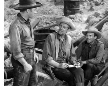
1949 BARRICADE (Barricade) de Peter Godfrey avec Dane Clark, Walter Coy