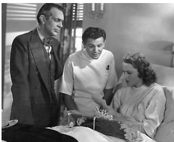
1941 DANGEROUS THEY LIVE de Robert Florey avec John Garfield, Nancy Coleman