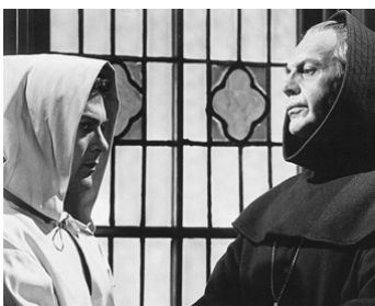
1960 LE ROI DES IMPOSTEURS (The great Impostor) de Robert Mulligan avec Tony Curtis