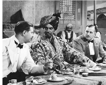
1937 ALERTE AUX INDES (The Drum) de Zoltan Korda avec Archibald Batty, Roger Livesey