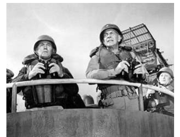
1958 LES NUS ET LES MORTS (The naked and the dead) de Raoul Walsh avec Richard Jaeckel