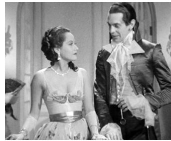
1935 LE CHEVALIER DE LONDRES (The Scarlet Pimpernel) d'Harold Young avec Merle Oberon