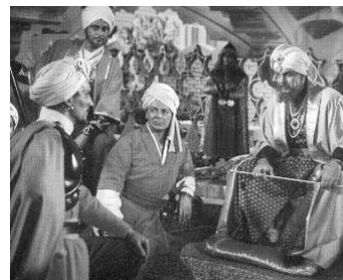
1957 LES AMOURS D'OMAR KHAYYAM (Omar Khayyam) de W. Dieterle avec Cornel Wilde