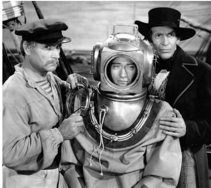
1942 LES NAUFRAGEURS DES MERS DU SUD (Reap the Wild Wind) de Cecil B. DeMille avec Victor Varconi, John Wayne