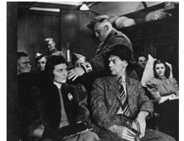
1941 LE QUARANTE-NEUVIÈME PARALLÈLE (49th Parallel) d'E. Pressburger & M. Powell