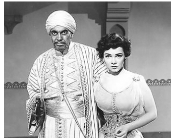
1953 LE CHANT DU DÉSERT (The Desert Song) d'H. Bruce Humberstone avec Kathryn Grayson