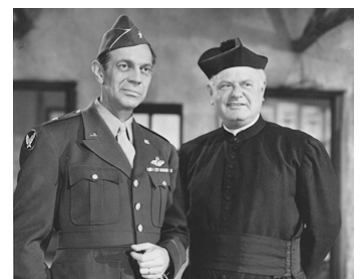
1945 BOMBES SUR HONG KONG (God is my co-pilot) de Robert Florey avec Alan Hale