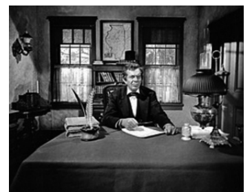
1962 LA CONQUÊTE DE L'OUEST (How the West was won) de John Ford