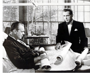
1949 LE PILOTE DU DIABLE (Chain Lightning) de Stuart Heisler avec Humphrey Bogart