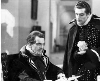
1936 L'INVINCIBLE ARMADA (Fire over England) de William K. Howard avec Laurence Olivier